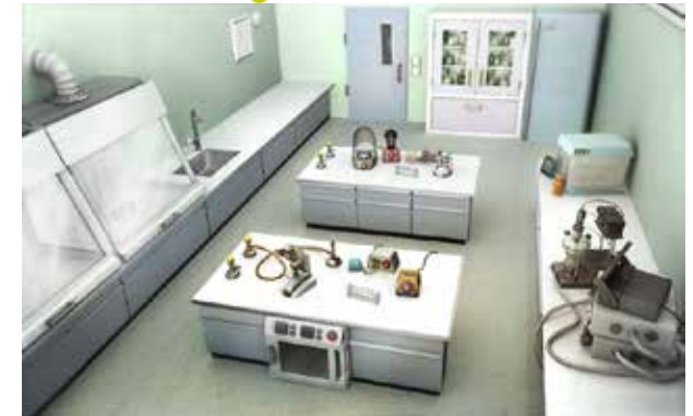
Het virtuele laboratorium, versie 2.0

In 2007 wilde een student systeembioogie aan de Technische Universiteit van Denemarken (DTU) graag talentvolle studenten samenbrengen. Hij bedacht een manier om de studie meteen in de praktijk te brengen: studenten ontwikkelen onderwijsmateriaal voor middelbare scholieren, op basis van nieuwe ontwikkelingen in het vakgebied. Voor de financiering klopte hij aan bij commerciële partners. Het werd meteen een succes. Het allereerste project, een virtueel laboratorium, kreeg steun van de overheid en is nu gratis beschikbaar voor alle middelbare scholieren.